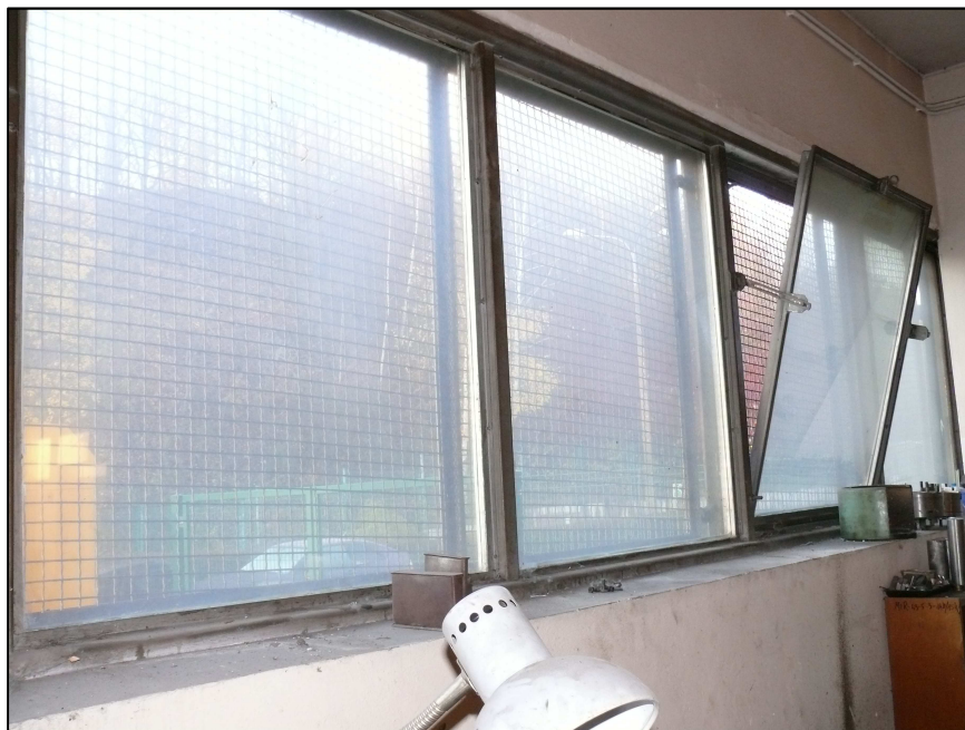
Fot.6 Istniejące, stare okna w warsztacie.