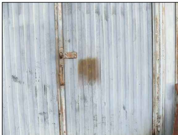
Fot.4 Widok uchwytu do otwarcia drzwi dwuskrzydłowych.