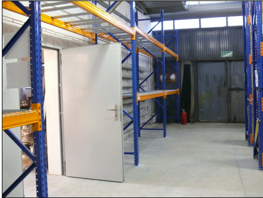
Fot.5 Widok z pomieszczenia 508 magazynu wysokiego składowania Po lewej widoczne wejście do warsztatu.