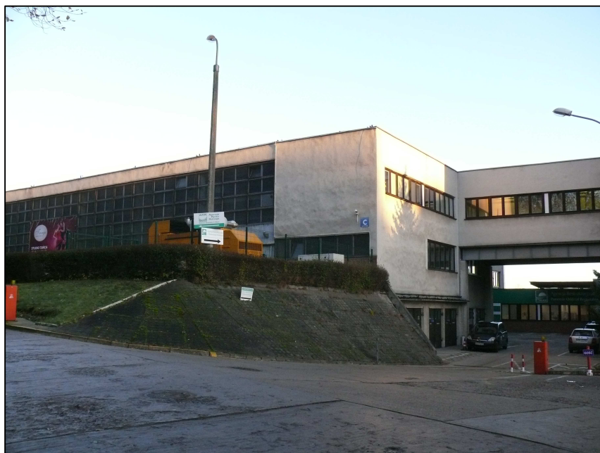
Fot.1. Widok od strony wjazdu od ul. Wolności. Warsztat mechaniczny jest zlokalizowany nad garażami