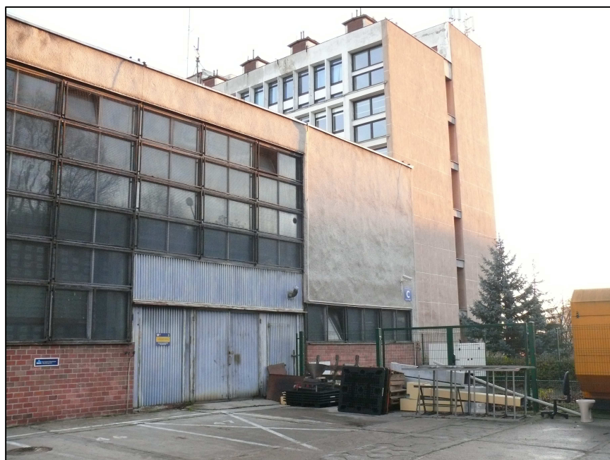
Fot.2 Widok od strony wejścia do pom.508 - magazyn wysokiego składowania. Po prawej stronie okna warsztatu ( planowana lokalizacja wejścia do warsztatu).