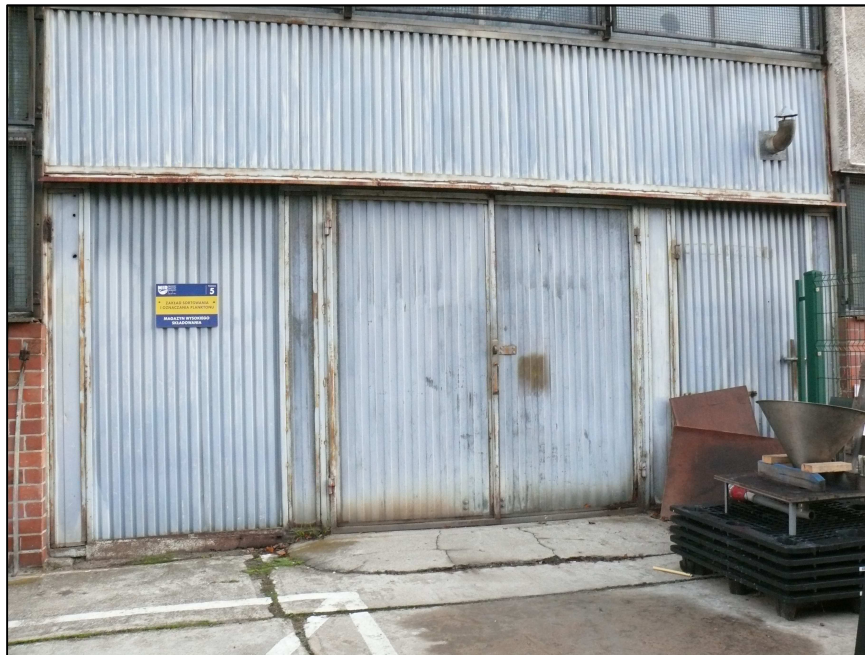
Fot.3. Istniejące drzwi wejściowe do pomieszczenia magazynu wysokiego składowania. Widoczne nierówności i spękania nawierzchni przed drzwiami wejściowymi.